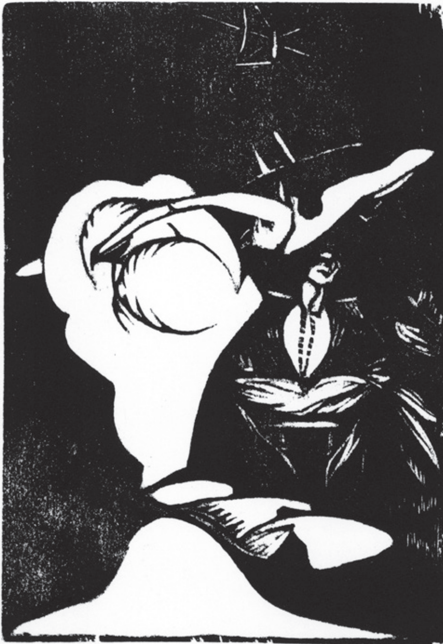
Sobrecubierta Xilografía. Pl. 180 x 125 mm