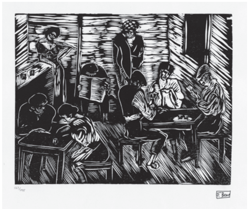
Sin título XV, 1922-1924 Xilografía. Pl. 235 x 300 mm