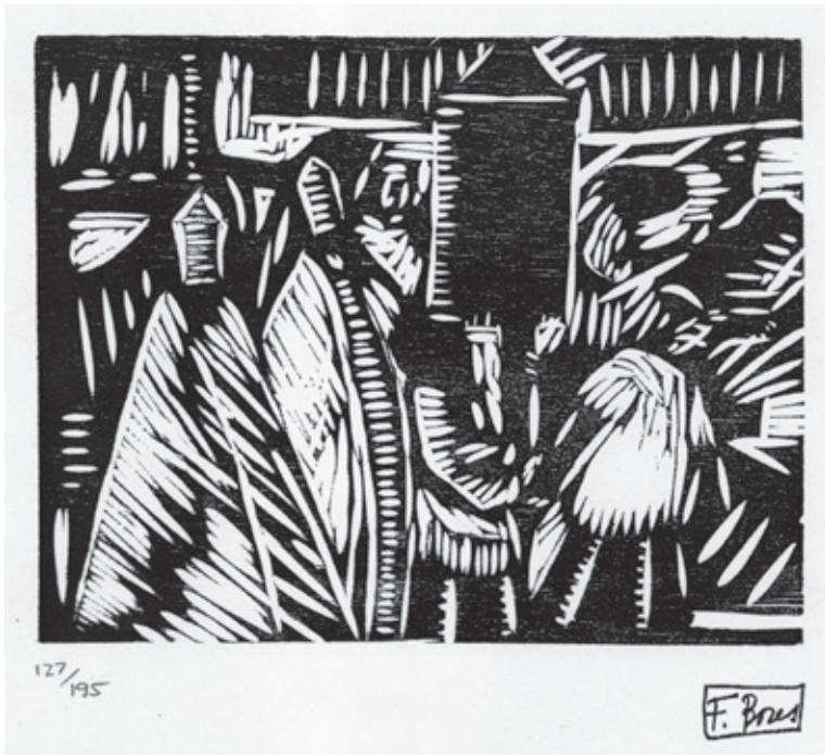
Sin título X Xilografía. Pl. 100 x 150 mm © Carmen Bores, Madrid, 2023