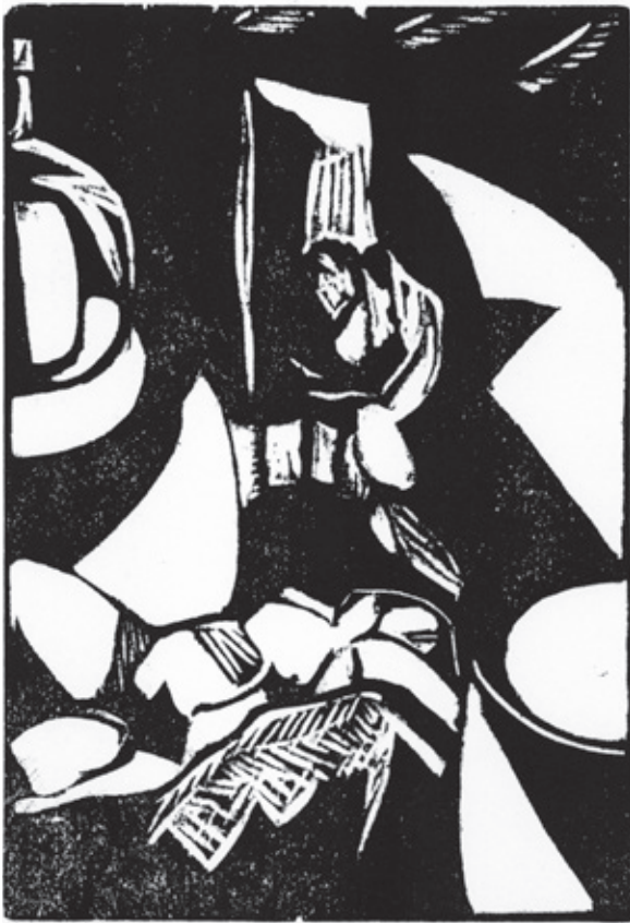
La caridad del Chepa Xilografía. Pl. 180 x 125 mm