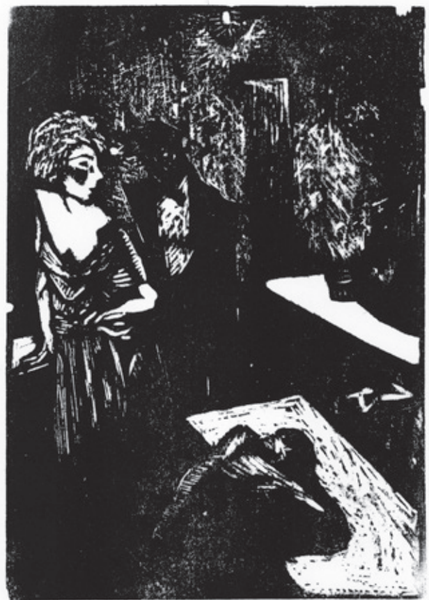
Los antros lóbregos Xilografía. Pl. 180 x 125 mm