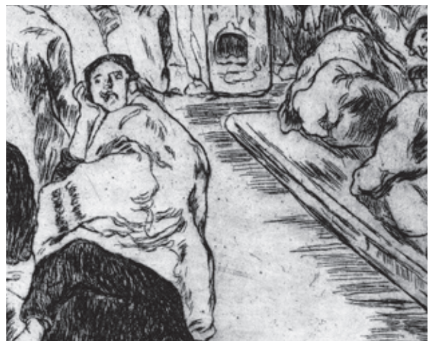
Fragmento de: José Gutiérrez Solana. Casa de dormir . Aguafuerte cobre