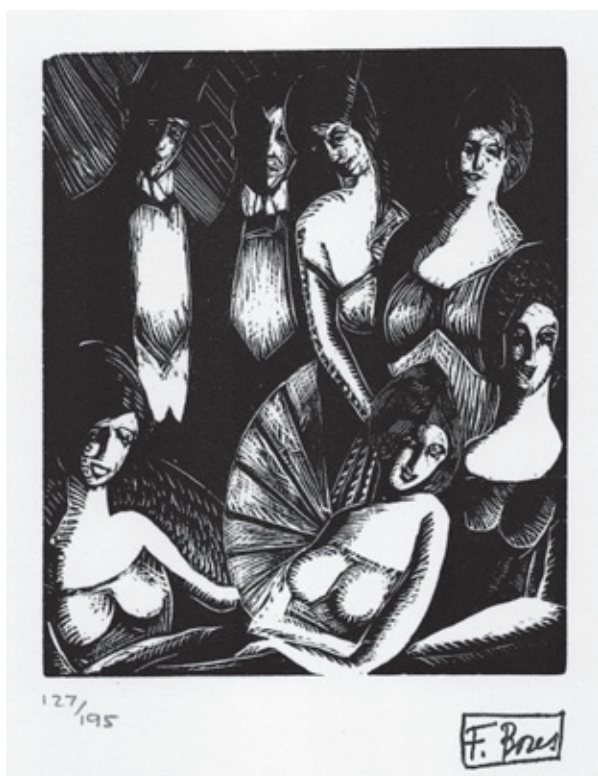
Sin título IV Xilografía. Pl. 120 x 100 mm © Carmen Bores, Madrid, 2023