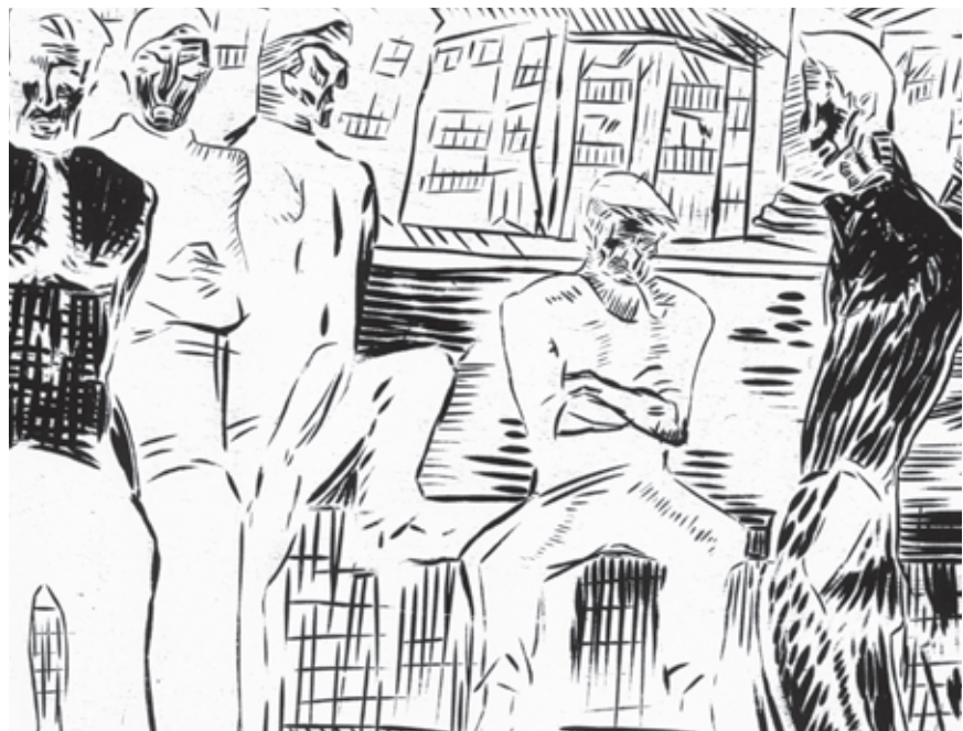
Francisco Bores. Frontispicio, 1922-1924. Xilografía, Pl.230 x 294 mm