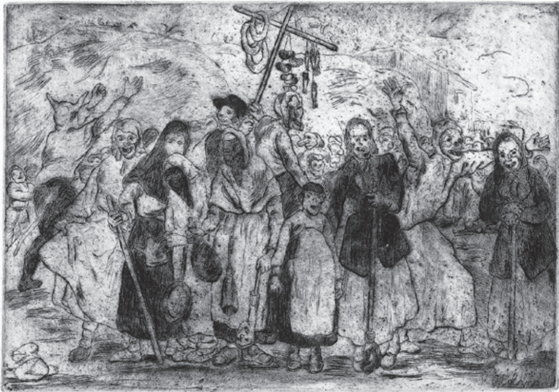
Máscaras en las afueras