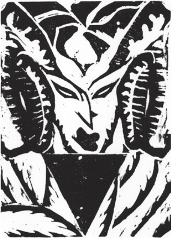
Sobrecubierta Xilografía. Pl. 190 x 140 mm