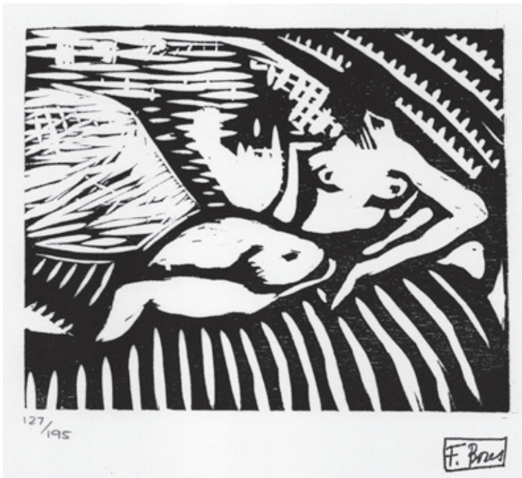
Sin título XII Xilografía. Pl. 120 x 150 mm © Carmen Bores, Madrid, 2023