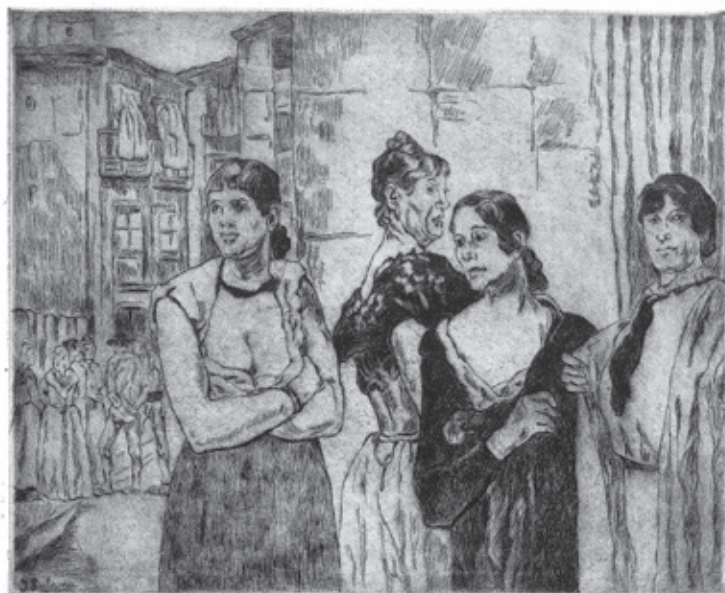
Mujeres de la vida

© Gutiérrez Solana, VEGAP, Santander, 2023