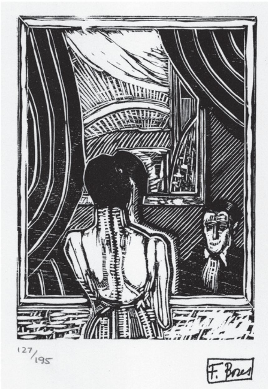
Sin título VI Xilografía. Pl. 140 x 100 mm © Carmen Bores, Madrid, 2023