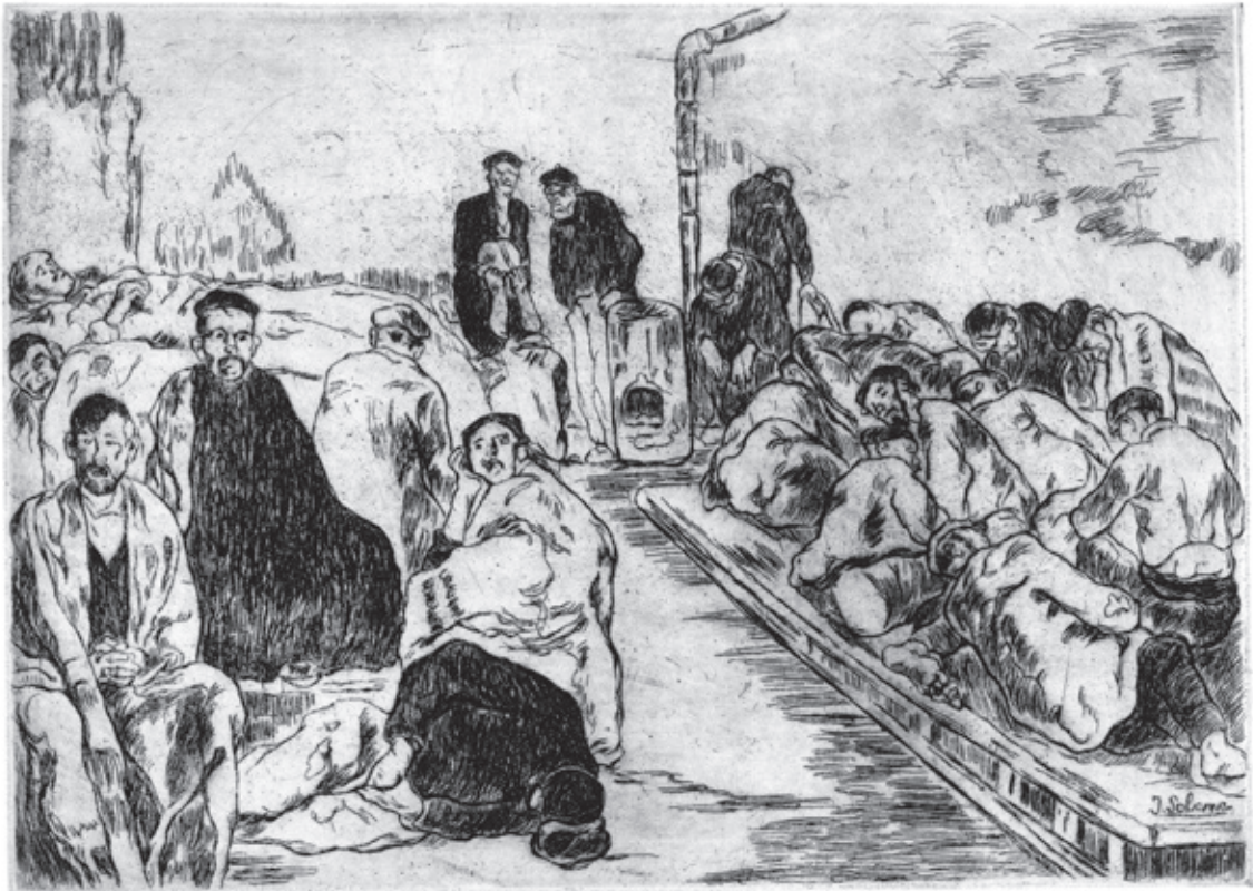
Casa de dormir