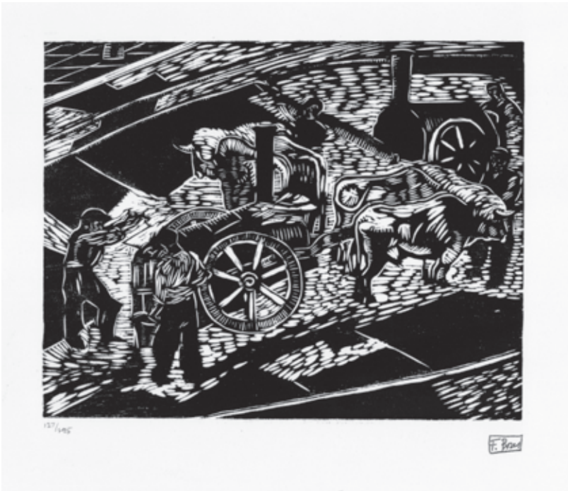
Sin título XIV Xilografía. Pl. 220 x 285 mm © Carmen Bores, Madrid, 2023