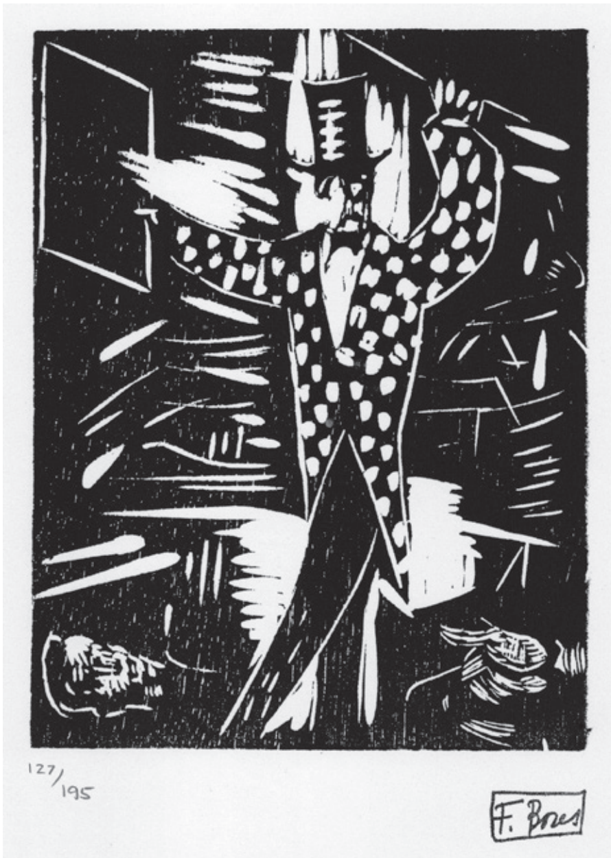
Sin título IX Xilografía. Pl. 150 x 115 mm © Carmen Bores, Madrid, 2023