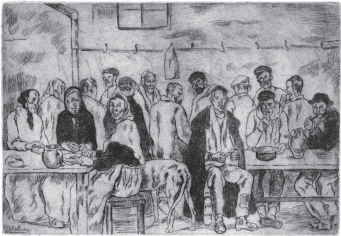
Comedor de los pobres