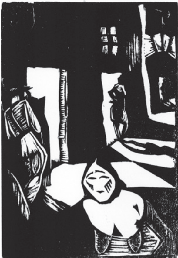
Calle Ceres Xilografía. Pl. 180 x 125 mm