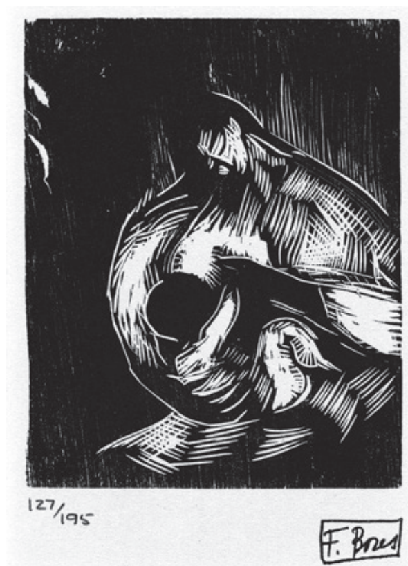
Sin título II Xilografía. Pl. 110 x 90 mm © Carmen Bores, Madrid, 2023