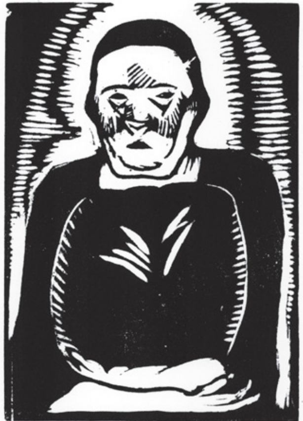
Vieja Claudia Xilografía. Pl. 180 x 130 mm