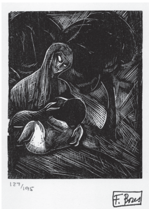
Sin título I Xilografía. Pl. 115 x 90 mm © Carmen Bores, Madrid, 2023