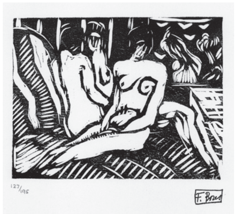
Sin título XIII Xilografía. Pl. 115 x 150 mm © Carmen Bores, Madrid, 2023