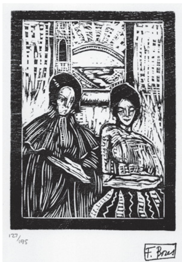
Sin título V Xilografía. Pl. 135 x 100 mm © Carmen Bores, Madrid, 2023