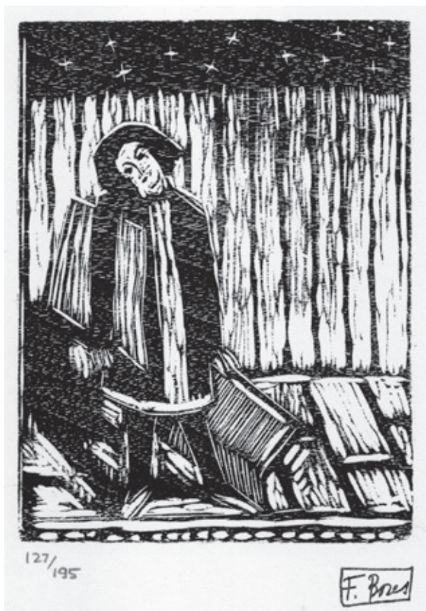
Sin título VII Xilografía. Pl. 135 x 105 mm © Carmen Bores, Madrid, 2023