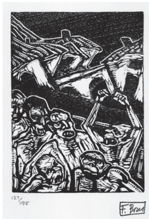
Sin título VIII Xilografía. Pl. 140 x 100 mm © Carmen Bores, Madrid, 2023