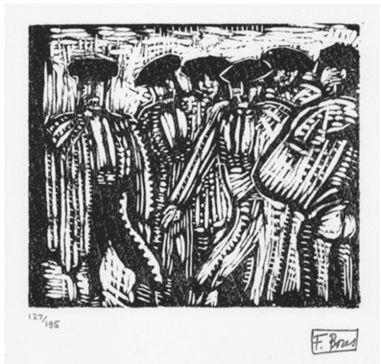
Sin título XI Xilografía. Pl. 120 x 140 mm © Carmen Bores, Madrid, 2023