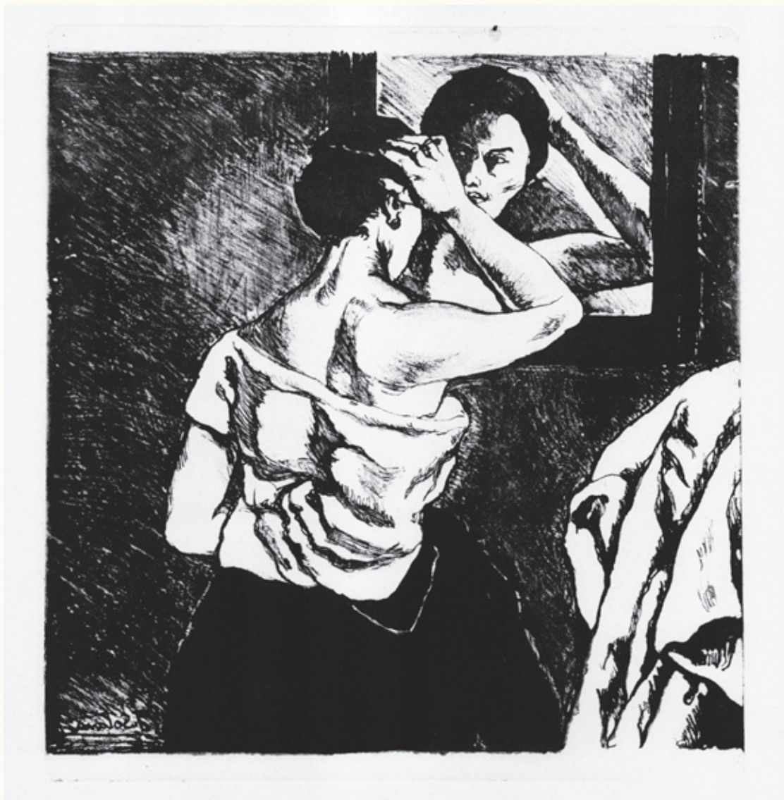
Mujer ante el espejo