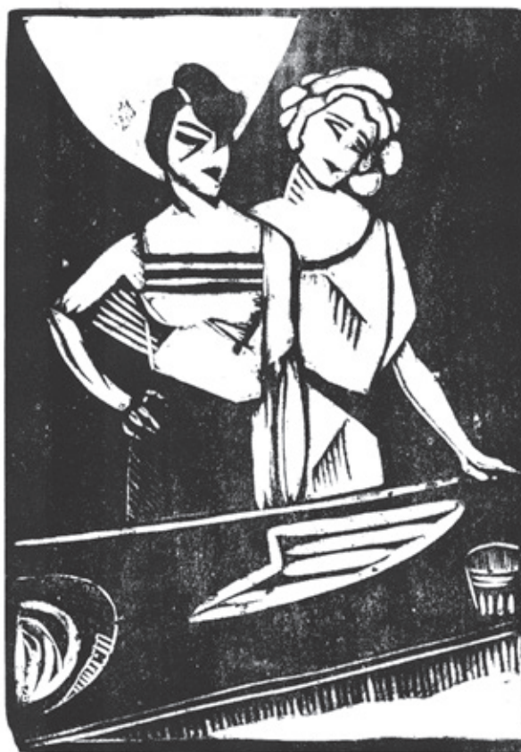
Cora y Enriqueta Xilografía. Pl. 180 x 125 mm