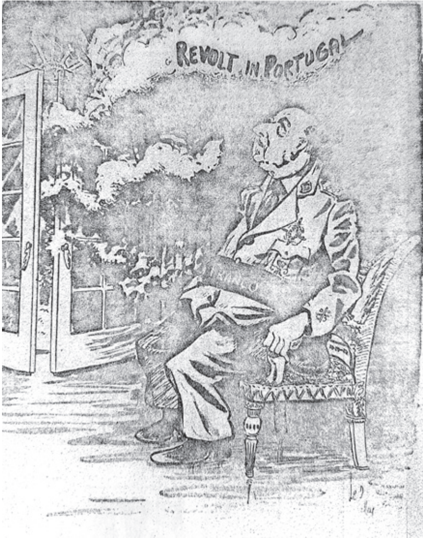
«Will Someone Please Shut the Window?». 4/5/1974. FUE_ARE.P/FV/56-58. P209_1

Por unas razones y por otras, los republicanos españoles llegaron a los últimos instantes de la vida del general Franco con una idea de democracia que, para ser plena (y por lo tanto, ser República ) sólo podía llevarse a cabo por la acción del pueblo español, de su soberanía...y de ellos mismos,