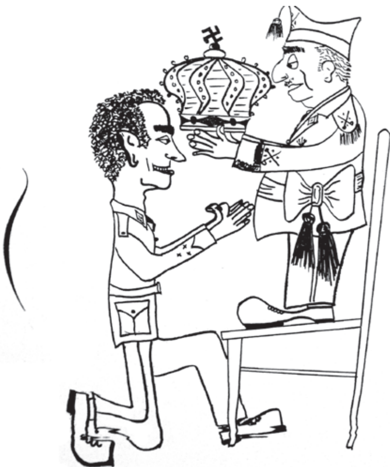
«La Instauración monárquica», por J. M. Armengol.

ésta a su propio liderazgo y régimen; de ahí el constante juego de palabras en torno al juramento de vasallaje y a una relación de vasallo y señor «no natural» entre Juan Carlos de Borbón y Franco. En el mismo número en que se publicaba el texto de Valera, una caricatura de J. M. d'Armengol retrataba el episodio de designación del sucesor de Franco, representando a un príncipe Juan Carlos arrodillado y recibiendo una corona rematada con una esvástica de manos del dictador, subido a una silla (ridiculizando claramente